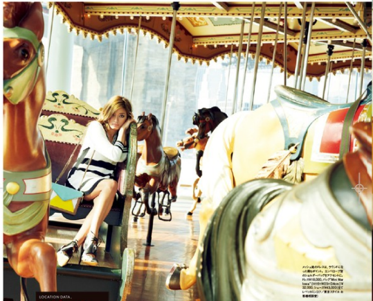
styling: NORA AMANO (www.nora-amano.com) / hair: JANEY (www.janey.com) / make-up: CHIEKO (www.chieko.com) / spot: Max Casarini (www.maxcasarini.com) / location: RENBRANT HOUSE (www.renbraanthouse.com) / set: NAKA SAKA (www.naka-saka.com)

LOCATION DATA Why the #1181? このロケーションは、レンブラント・ハウスのロケーションに決定しました。レンブラント・ハウスは、17世紀の建築で、レンブラントの作品が展示されています。このロケーションは、レンブラント・ハウスのロケーションに決定しました。レンブラント・ハウスは、17世紀の建築で、レンブラントの作品が展示されています。