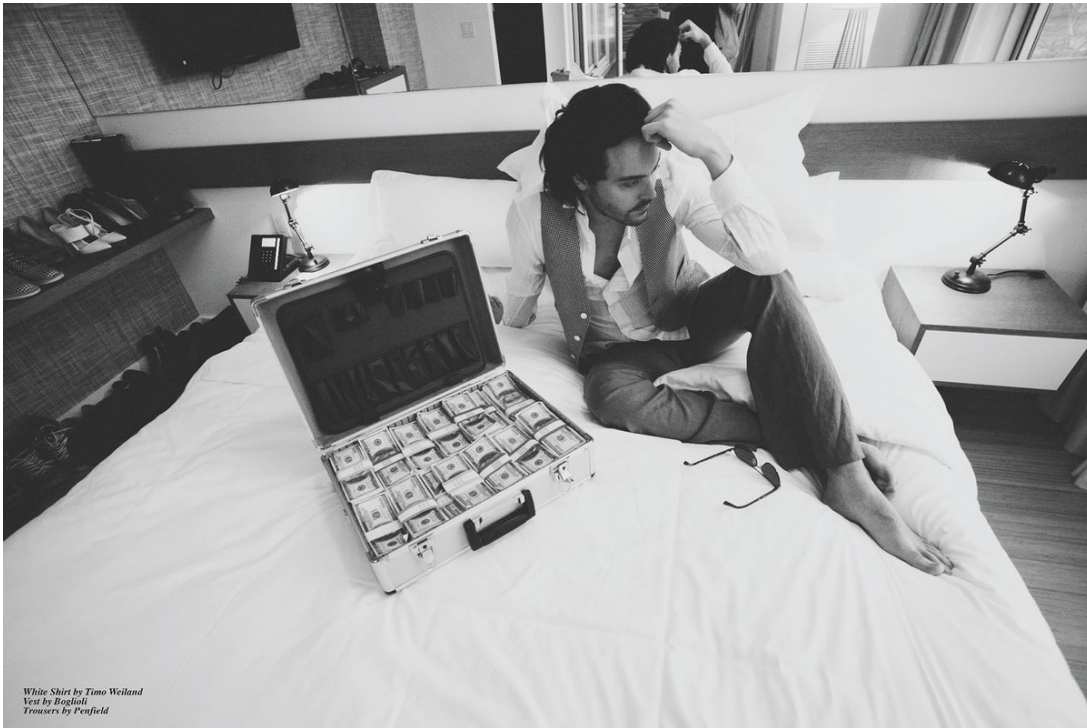
White Shirt by Timo Weiland Vest by Boglioli Trousers by Penfield