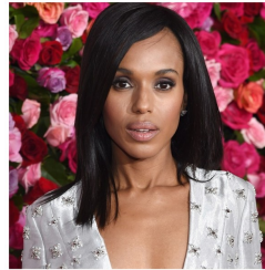
Kerry Washington Look closely at Kerry Washington's subtle smoky eye and you'll see that her inner eye has a hint of sparkle. It's a gorgeous combination to her cheek pink lip and super-soft hair.