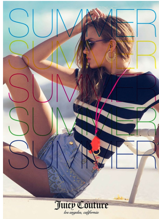
Juicy Couture los angeles, california