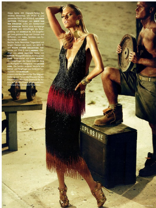
Diese Seite: Mit Degradé-Perlen besticktes Seidenkleid, um 24200 €, und passender Rock, um 30500 €, von LOUIS VUITTON . Ohrlöcher von MARK VAN DER STRAATEN . Lila- und Goldarmband von SCHEULIN . Rechts eine Armbänder von STED . Am Mittelfinger ein Ringgoldring mit einem braunen Turmalin und Brillanten, von KARA . Sandalen aus Pyritstiefeln, von SWISS . Rechte Seite: Besticktes Trägerkleid mit langen Fransen am Saum, um 8350 €, von RAHM LAMM collection. Ohrlöcher, um 2350 $, von J. WASSER . Ohrring, von LOUIS VUITTON . Kette von LAMM . Ringgoldarmband von STED . Ringgoldring am Mittelfinger von KARA . Am Zeigefinger der Hand links ein Ring aus Ringgold mit Malachit, von JOCHEN POHL . Die beiden anderen Modelle am Mittelfinger und Ringfinger aus Gold mit Turmalinen, von SCHEULIN . Make-up von Tyson Malibu für Art Department. Marketing: Diana Di für Art Department. Christiane Art, Bremerhaven.