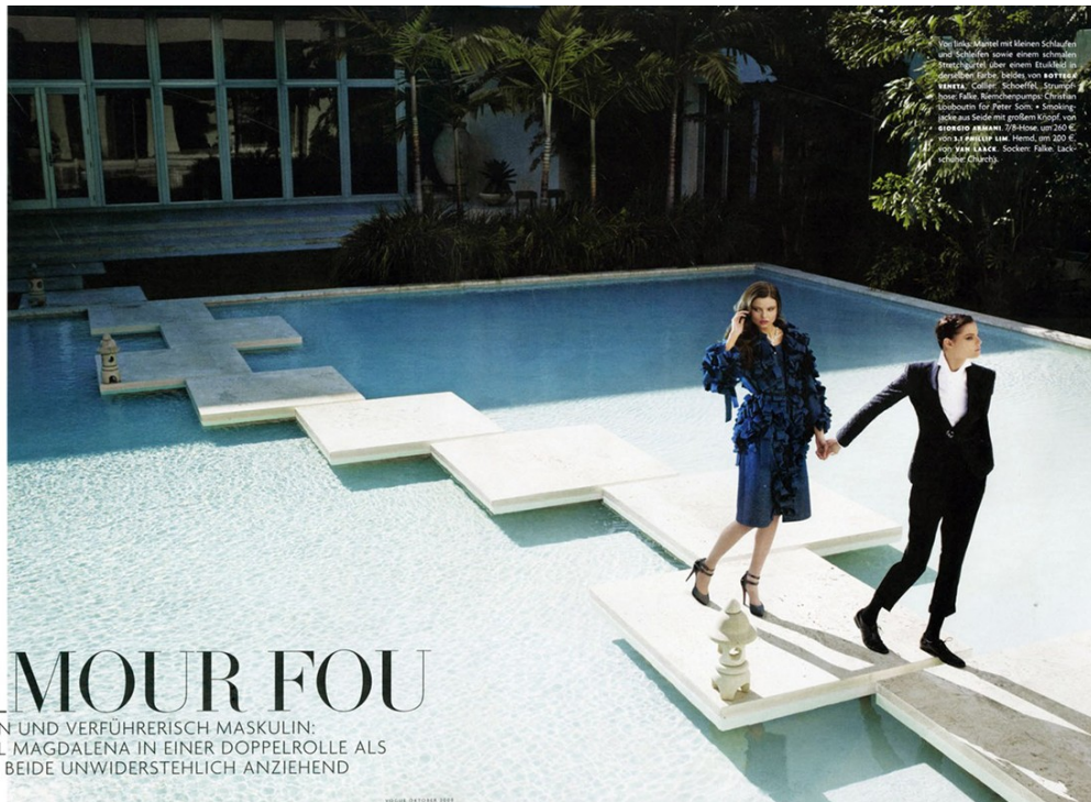
Wir lang' schaltet mit Meinen Schaefer und Schaefer sowie einem schmalen Strickgürtel über einem Einsteck- oder über dem Hals: Beides von ROBERTO BENNETTA . Collar: Schoffel . Strumpf: John Felle . Randschleppende Chiffon-Shorts für Peter Salm: Sinking . Rechts aus Seiden mit großem Kragen: von GIORGIO ARMANI . T-Shirt: um 200 €, von A.J. PELLER LHM . Hemd, um 200 €, von PAUL LANCE . Jackett: Falte, lack-schwarze Chiffon.