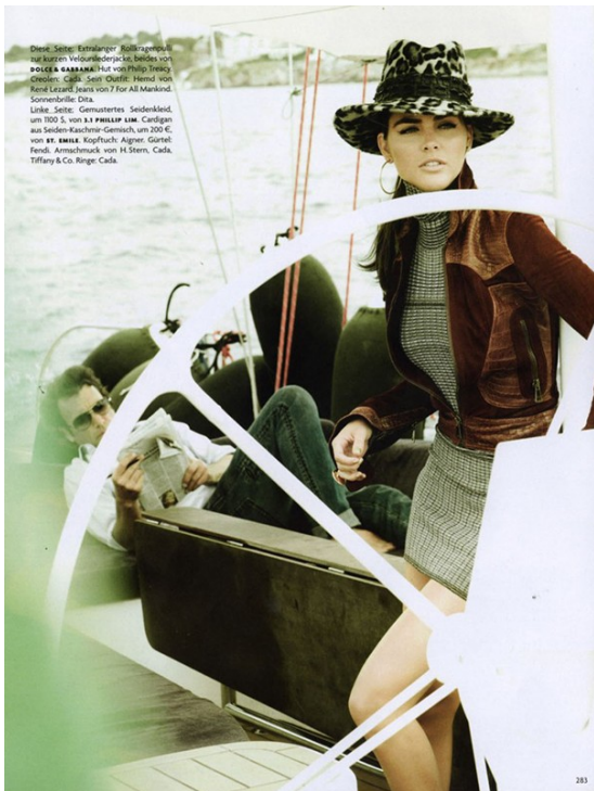
Diese Seite: Einmaliger Roll-up-poncho mit kurzen Vordrillärmeln in helles von BOLEA & BARBARA . Hut von Philip Treacy. Ohrring: Cadi. Stoff Gürtel: Hemd von René Lezard. Jeans von 7 For All Mankind. Sonnenbrille: Dita. Linke Seite: Gemustertes Seidenkleid, um 1000 €, von J.P. PHILLIP LIM . Cardigan aus Seiden-Kaschmir-Gemisch, um 200 €, von ST. AMIRA . Kopfputz: Alpiner Gürtel: Fendi. Armband: von H. Stern. Cads, Tiffany & Co. Ring: Cads.