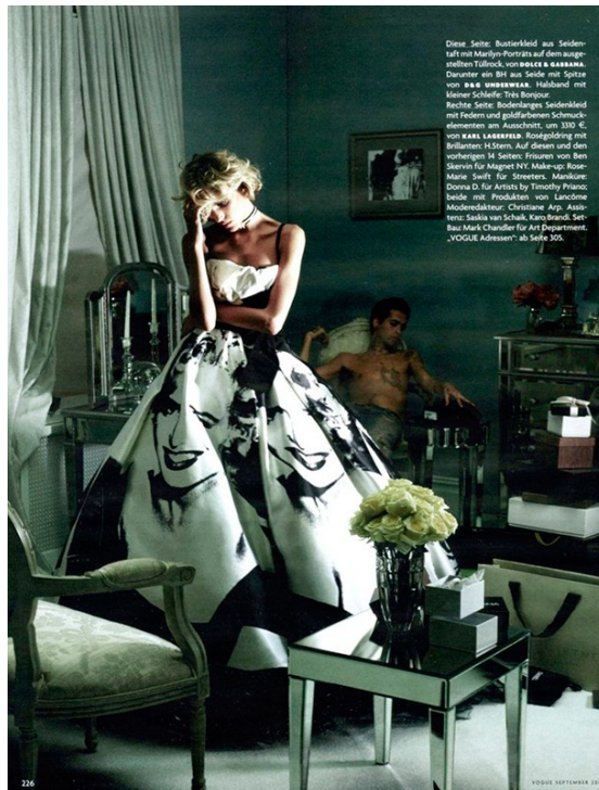
Diese Seite: Bustierkleid aus Seidenstoff mit Marilyn-Porträts auf dem ausgefallenen Tüllrock, von BOSS & BASSANO . Darunter ein BH aus Seide mit Spitze von BOSS WEISSER . Halsband mit kleiner Schließe: Toto Boujour . Rechte Seite: Bodentlanges Suedlederkleid mit Federn und polierten Schmuckelementen am Ausschnitt, um 330 €, von RAE LAKERRA . Ringgoldring mit Brillanten: H.Stein . Auf diesen und den vorherigen 14 Seiten: Haar von Ben Givner für Margot NYC ; Makage Rose-Marie Swift für Streeters ; Maniküre : Donna D. für Artists by Timothy Francis ; beide mit Produkten von Lancôme . Modell : Christine Agbasi . Stil : Saskia van Schalk , Karo Brandt . Set : Mark Chandler für Art Department . VOGUE Adressen ab Seite 90.