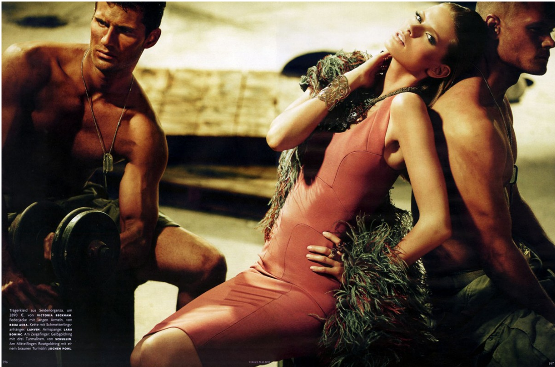
Trägerkleid aus Seidenorganza, um 3890 €, von VICTORIA BECKHAM . Federkette mit langen Ärmeln, von ARM AERA . Kette mit Schmetterlingsanhänger KANYE . Armbänder KARA SCHWIG . Am Zeigefinger Goldring mit drei Turmalinen, von SCHEULIN . Am Mittelfinger Ringgoldring mit einem braunen Turmalin, JOCHEN POHL .