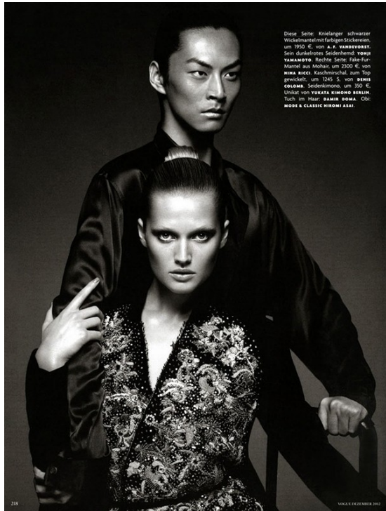
Diese Seite: Kordanger schwarzer Wickelanzug mit farbigen Stickereien, um 1990 €, von A. F. VANNOVIST . Sein dunkelrotes Seidenhemd: YUKI YAMAMOTO . Rechte Seite: Falte-Pur-Nadel aus Molan, um 2000 €, von MIMI RICH . Kaschmirschawl, zum Top gewandelt, um 1245 $, von BIBES COLINA . Seidenkombi, um 350 €, Linkel, von YUKATA KIMONO BERLIN . Tuch im Haar: DAVID BONA . Obi: MOSE & CLASSIC HIROSHI ASAI .