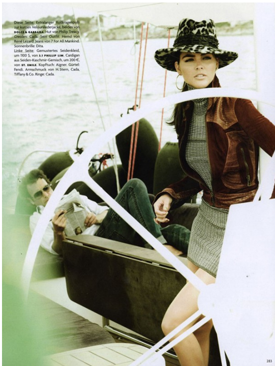
Diese Seite: Einmaliger Roll-up-oversize mit kurzen Vordrillärmeln in helles von BOLEA & BARBARA . Hut von Philip Treacy. Choker: Cads. Stoff Gürtel: Hemd von René Lezard. Jeans von 7 For All Mankind. Sonnenbrille: Dita. Linke Seite: Gemustertes Seidenkleid, um 1000 €, von J.P. PHILLIP LIM . Cardigan aus Seiden-Kaschmir-Gemisch, um 200 €, von ST. AMIRA . Kopfputz: Alpiner Gürtel: Fendi. Armband: von H. Stern. Cads, Tiffany & Co. Ring: Cads.