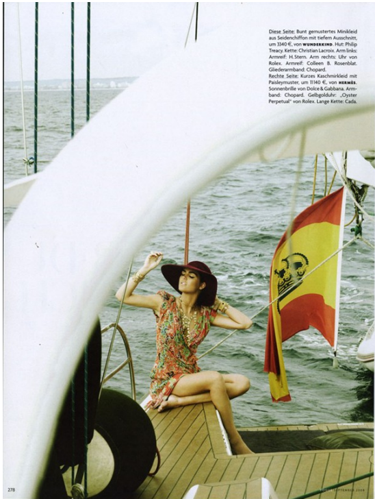
Diese Seite: Kurz gemustertes Miniobd aus Seidenchiffon mit tiefem Ausschnitt, um 3340 €, von WUNDERKIND . Hut: Philip Treacy. Kette: Christian Lacroix. Armreife: Armreif: H. Stern. Arm rechts: Uhr von Rolex. Armreif: Gürtel: B. Rosenblatt. Gliederarmband: Chopard. Rechte Seite: Kurzes Kaschmirkleid mit Paisleymuster, um 1140 €, von BARBARA . Sonnenbrille von Dolce & Gabbana. Armband: Chopard. Gefäßgehör: Oyster Perpetual von Rolex. Lange Kette: Cads.