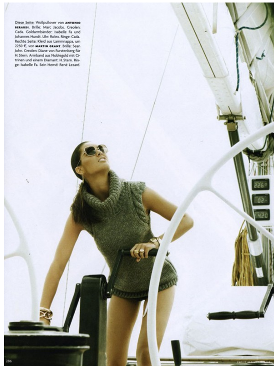
Diese Seite: Wollpullover von ANTONIO MARRAS . Brille: Marc Jacobs. Crenell: Cads. Goldarmbänder: Isabelle. Fa. und Johannes Kundi. Uhr: Rolex. Ring: Cads. Rechte Seite: Kleid aus Lammwolle, um 2200 €, von MARKUS GRABY . Brille: Sean John. Crenell: Diane von Furstenberg für H. Stern. Armband aus Nubelgold mit Citrinen und einem Diamant: H. Stern. Ring: Isabelle Fa. Sein Hemd: René Lezard.