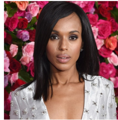
Kerry Washington Look closely at Kerry Washington's ombre smoky eye and you'll see that her lower lash line has a hint of sparkle. It's a gorgeous complement to her cheater pink lip and super-soft hair.