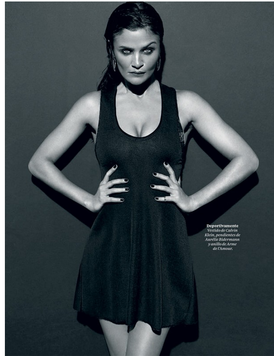
Deportivamente Vestido de Calvin Klein, pendientes de Aurelie Bidermann y anillo de Arme de l'Amour.