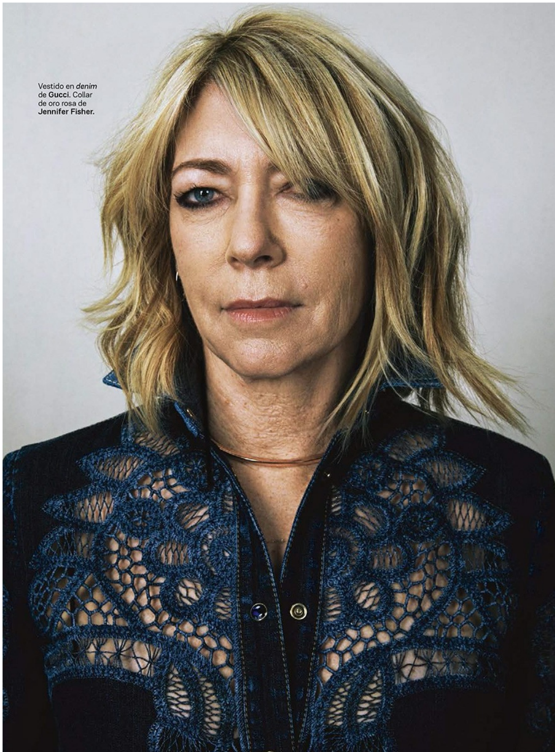
Vestido en denim de Gucci . Collar de oro rosa de Jennifer Fisher .